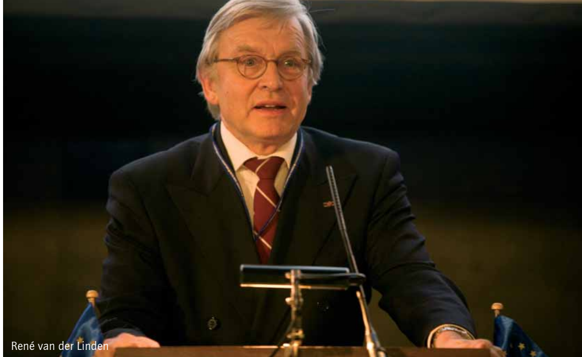
René van der Linden